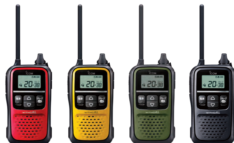
メタリックレッド JANコード:4909723122296 メタリックイエロー JANコード:4909723122289 ダークグリーン JANコード:4909723137870 ブラック JANコード:4909723122272